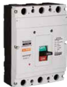
Interruptores de Caja Moldeada ELCM6