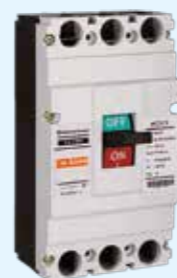
Interruptores de Caja Moldeada ELCM5