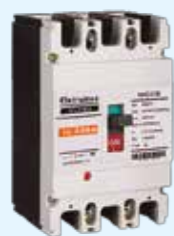
Interruptores de Caja Moldeada ELCM3