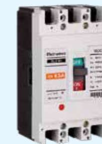
Interruptores de Caja Moldeada ELCM1