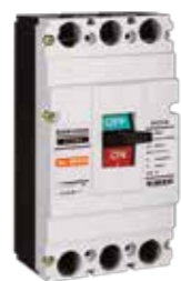
Interruptores de Caja Moldeada ELCM4