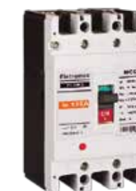
Interruptores de Caja Moldeada ELCM2